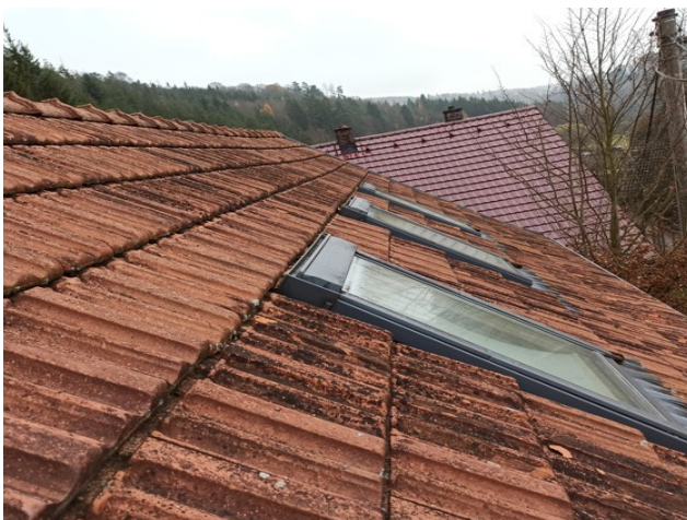
foto/3/ Pohled na předmětnou střešku

Střeška objektu je sedlová dvouplášťová s dřevěnou nosnou konstrukcí. Střešní krytinu tvoří pálené keramické tašky. Tepelnou izolaci ve střešním plášti tvoří měkká rohož z minerálních vláken uložená mezi dřevěnými krokviemi (v místě šikmin). Šikminy a svislé stěny navazující na šikminy v místě pozednic jsou tvořené SDK konstrukcí. Plochy střešky jsou vyspádovány k podokapním žlabům, které jsou odvodněné svislými dešťovými svody. Při průzkumu byl změřen sklon střešky na cca 40°. Obvodové stěnové konstrukce objektu jsou zděné a nejsou opatřené tepelnou izolací. Nad rovinu střešky vystupují střešní okna, fotovoltaické panely, komínová tělesa, a konstrukce hromosvodu.