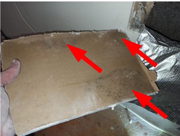
foto/27/ Pohled na SDK desku napadenou plísní z exteriérové strany