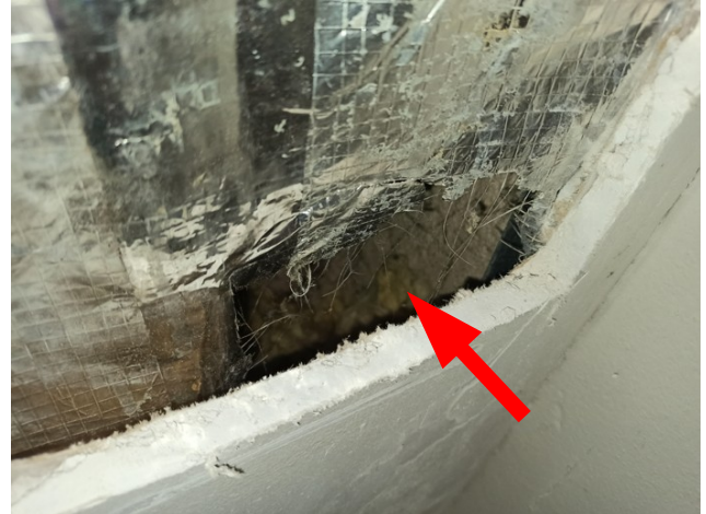
foto/22/ Pohled na poškozenou parozábranu v místě sondy S1, patrně vlivem působení živočichů