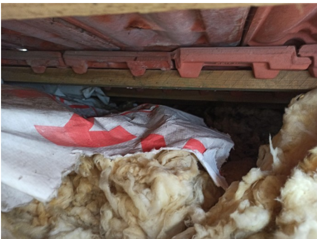
foto/19/ Pohled na poškozenou, necelistvou a různě rozházenou tepelnou izolaci