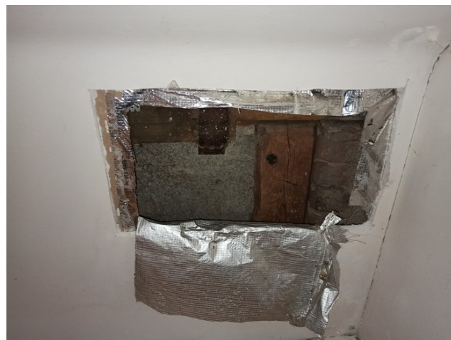
foto/8/ Pohled na provedenou sondu S1