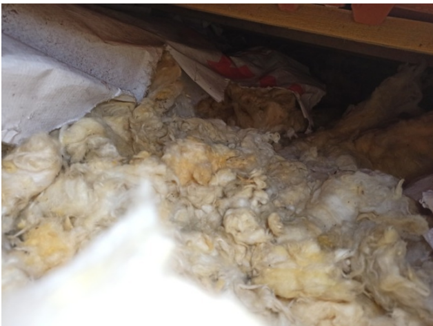
foto/17/ Pohled na poškozenou, necelistvou a různě rozházenou tepelnou izolaci

Tepelnou izolaci ve střešním plášti tvoří měkká rohož z minerálních vláken uložená mezi dřevěnými krokviemi (v místě šikmin) a na parotěsnicí fólii lehkého typu. Celková tloušťka tepelné izolace je cca 180 mm. V místech sond byla tepelná izolace nalezená necelistvá, patrně poničená vlivem působení živočichů a různě rozházená. Lokálně byly nalezeny trusy od živočichů.