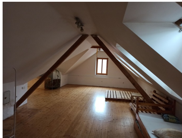
foto/6/ Pohled na podkroví