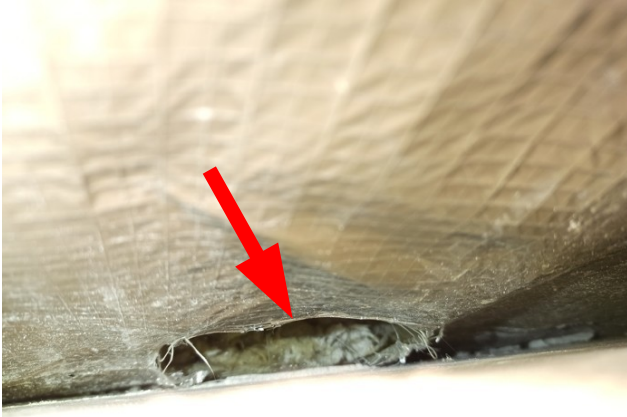
foto/21/ Pohled na poškozenou parozábranu v místě sondy S1, patrně vlivem působení živočichů

Jako parotěsnicí vrstva střechy je použita hliníková fólie lehkého typu s výztužnou vložkou. V místě ukončení parotěsnicí fólie u navazujících konstrukcí byla fólie přikotvena pomocí hliníkového profilu. V místě sondy S1 byla parotěsnicí fólie zdegradovaná a poškozená, patrně vlivem působení živočichů.