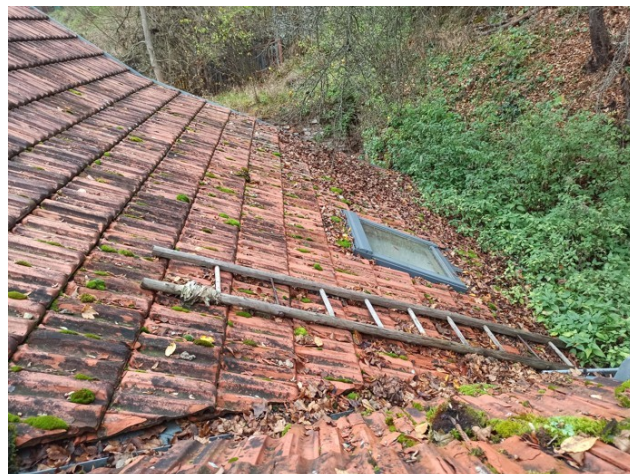
foto/14/ Pohled na znečištěnou střešní krytinu