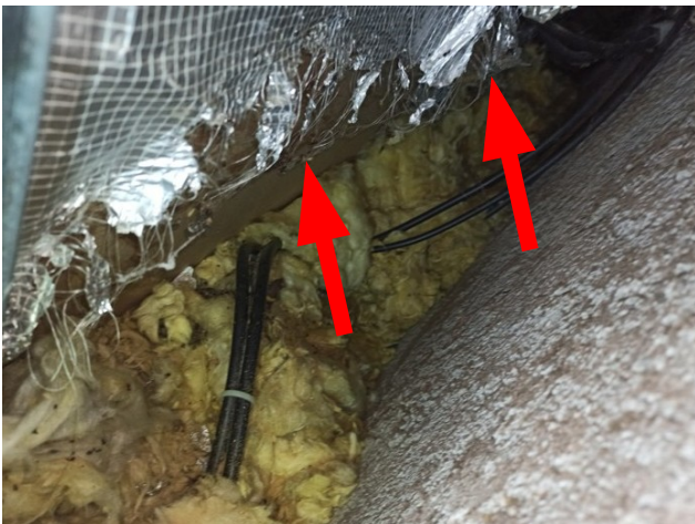
foto/23/ Pohled na poškozenou parozábranu v místě sondy S1, patrně vlivem působení živočichů