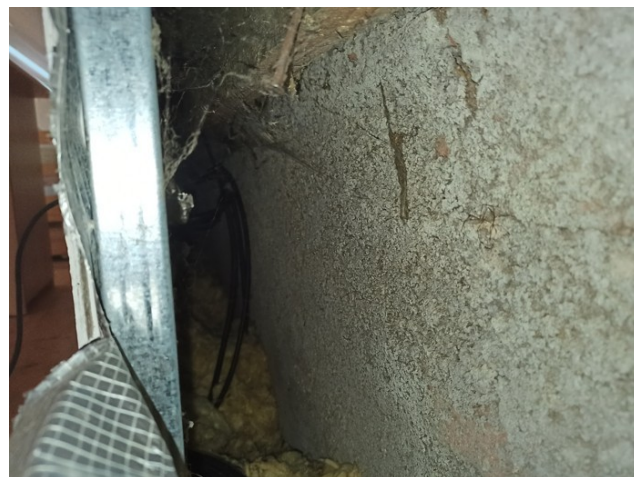
foto/10/ Pohled do dutiny za svislou SDK konstrukcí