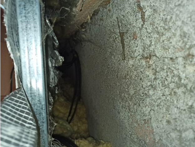
foto/25/ Pohled do dutiny za SDK předstěnou – tepelná izolace pouze v úrovni podlahy

Šikminy a svislé stěny navazující na šikminy v místě pozednic jsou tvořené SDK konstrukcí (předstěnou). V dutině za SDK předstěnou se nenachází tepelná izolace. Vlivem ne celistvosti tepelné izolace, celoplošně porušené DHV a zdegradované a poškozené parozábrany dochází za svislými částmi SDK konstrukce k proudění exteriérového vzduchu. Dále bylo v rámci průzkumu zjištěno napadení SDK desek plísní a to jak z interiérové strany tak strany exteriérové.