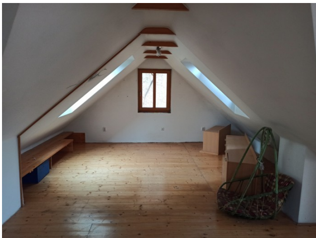
foto/5/ Pohled na podkroví