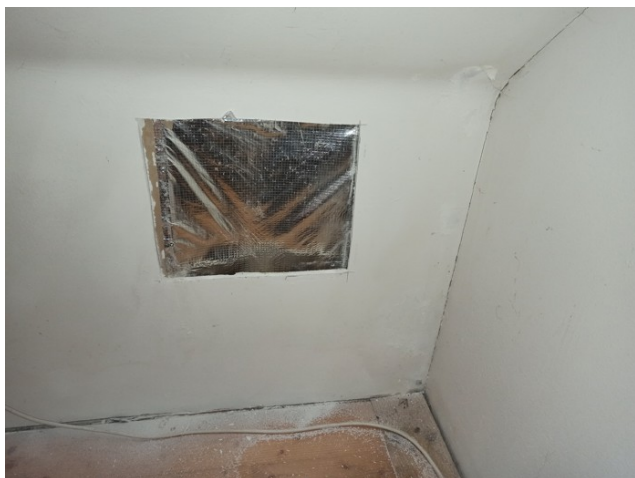
foto/7/ Pohled na provedenou sondu S1