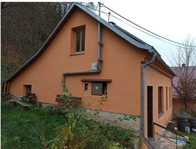
foto/1/ Pohled na předmětný objekt

Dle informací uživatele domu je zejména v zimních měsících obtížné vytopit prostory podkroví. Obvodové konstrukce v podkroví se převážně v zimních měsících prochlazují, což je patrné na dotek. Objednatel požaduje provést průzkum současného stavu podstřešních konstrukcí z hlediska stavební fyziky, funkčnosti a samotného provedení těchto konstrukcí. Objednatel dále požaduje návrh koncepce nápravných opatření.