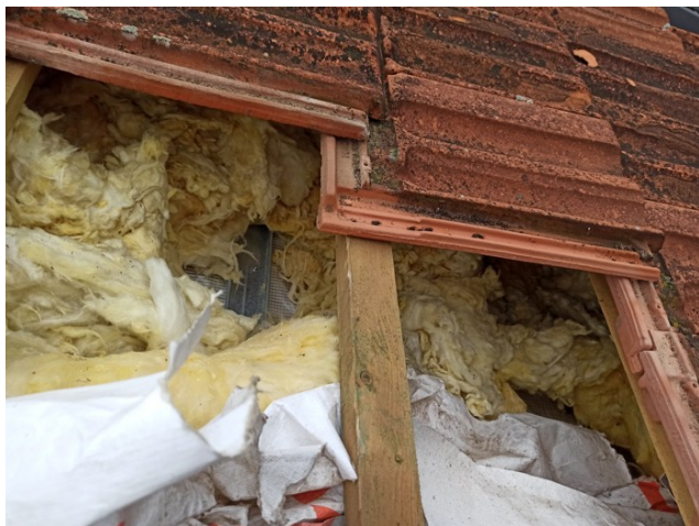
foto/11/ Pohled na provedenou sondu S2