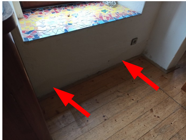
foto/30/ Pohled na vlhkostní mapu na obvodové stěně