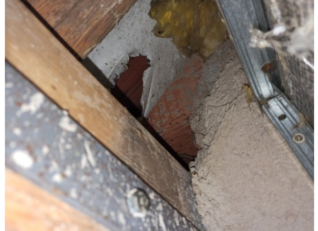
foto/26/ Pohled do dutiny za SDK předstěnou – patrná střešní taška skrz poškozenou DHV