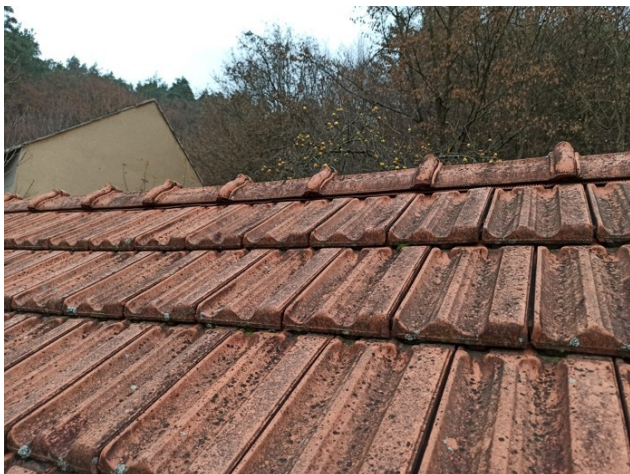
foto/13/ Pohled na střešní krytinu s biotickým napadením horního povrchu

Střešní krytinu tvoří pálené keramické tašky. Jedná se tašku s drážkováním v hlavové i boční části (typ Falcovka). Na povrchu tašek je patrné biotické napadení horního povrchu a silné znečištění. Lokálně jsou tašky popraskané.