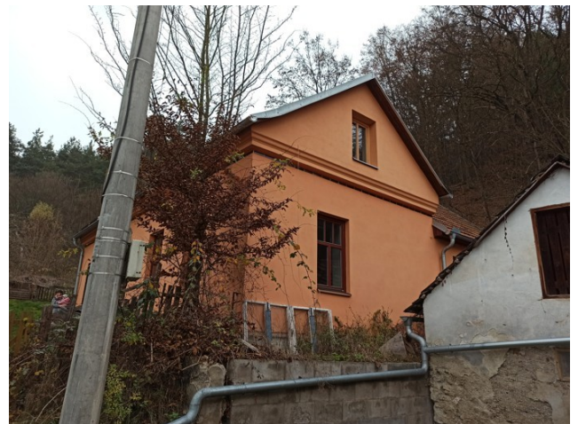
foto/2/ Pohled na předmětný objekt