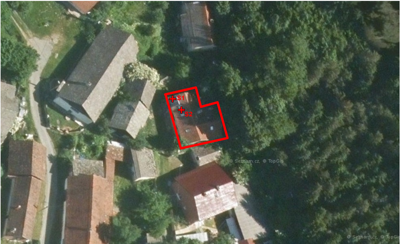
obr. 11/ Situace (červeně vyznačený předmětný objekt a jednotlivé sondy)

Sonda S1 byla provedena do SDK konstrukce ze strany interiéru. Sonda S2 byla provedena do šikmé střechy ze strany exteriéru.