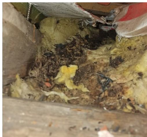
foto/20/ Pohled na trusy od živočichů na tepelné izolaci