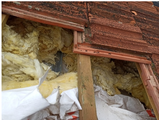
foto/18/ Pohled na poškozenou, necelistvou a různě rozházenou tepelnou izolaci