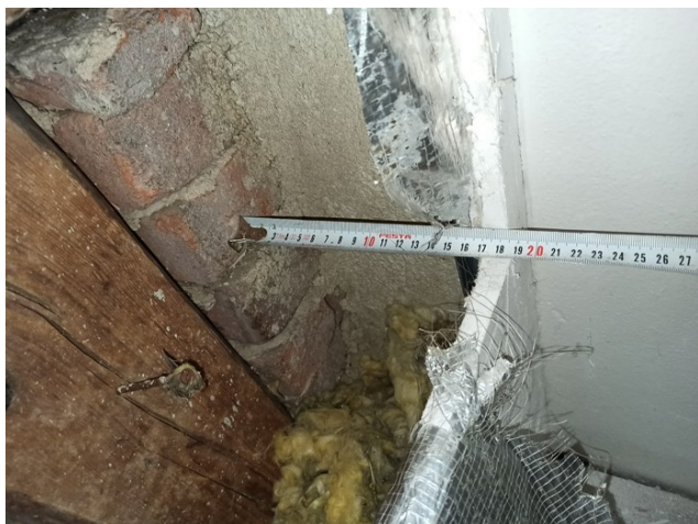
foto/9/ Pohled na provedenou sondu S1