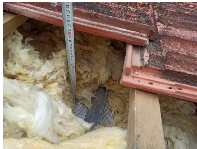
foto/12/ Pohled na provedenou sondu S2