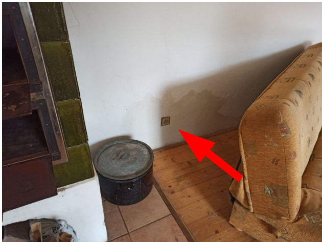
foto/29/ Pohled na vlhkostní mapu na vnitřní stěně

Při místním šetření byly zjištěny vlhkostní poruchy na vnitřních i vnějších stěnách. Tyto vlhkostní poruchy se projevily tvorbou vlhkostních map vzlínajícího charakteru.