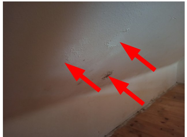
foto/28/ Pohled na SDK desku s vlhkostními projevy a napadením plísní z interiérové strany