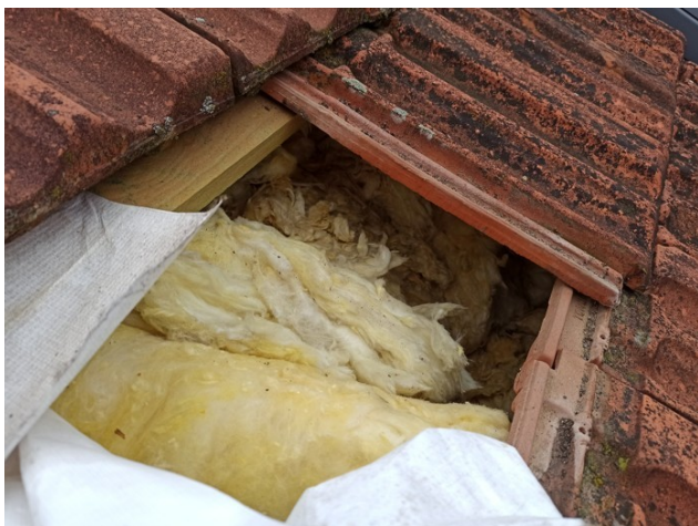
foto/15/ Absence DHV po demontáži střešních tašek

Doplňková hydroizolační vrstva (dále fólie) je tvořena difúzně otevřenou fólií lehkého typu. Fólie je kotvena ke krokvím pomocí kontralatí. Při místním šetření bylo zjištěno celoplošné poškození fólie pravděpodobně působením živočichů, fólie je celoplošně roztrhaná.