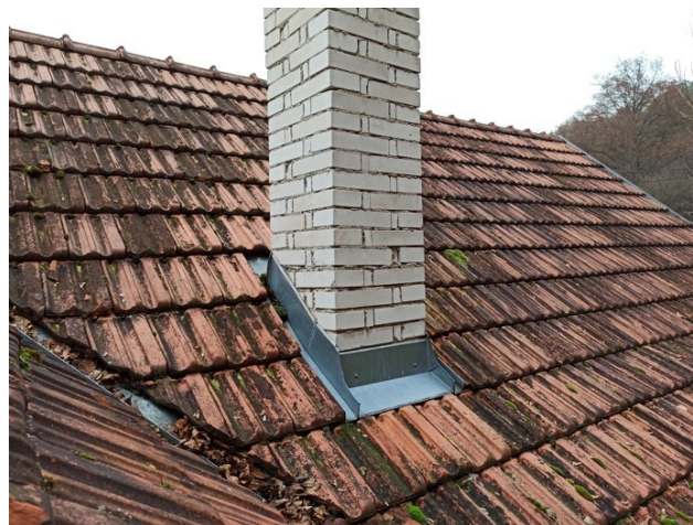
foto/4/ Pohled na předmětnou střešku