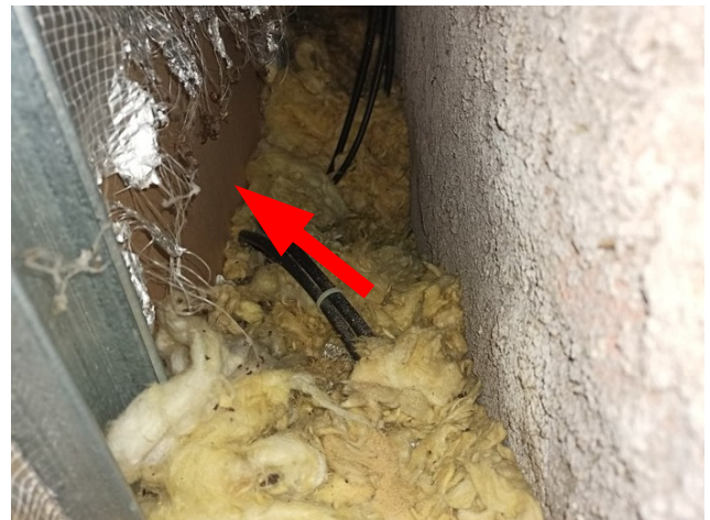
foto/24/ Pohled na poškozenou parozábranu v místě sondy S1, patrně vlivem působení živočichů