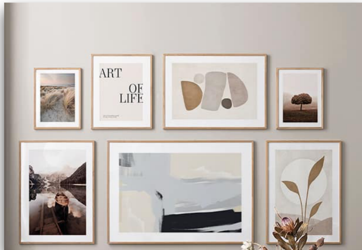
Nástěnná dekorace - skrumáž obrazů s volným námětem např. Desenio.cz