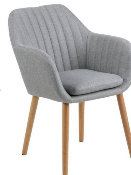
Křesílka k jídelnímu stolu, sv. Šedá