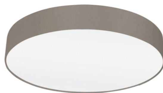
Stropní přisazené svítidlo