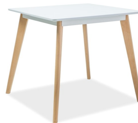
Malý jídelní stůl 80x80 cm, bílá