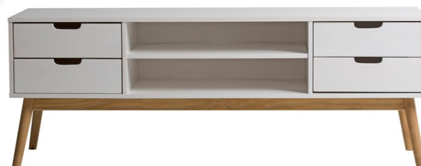
Skříňka pod TV š. 150 cm