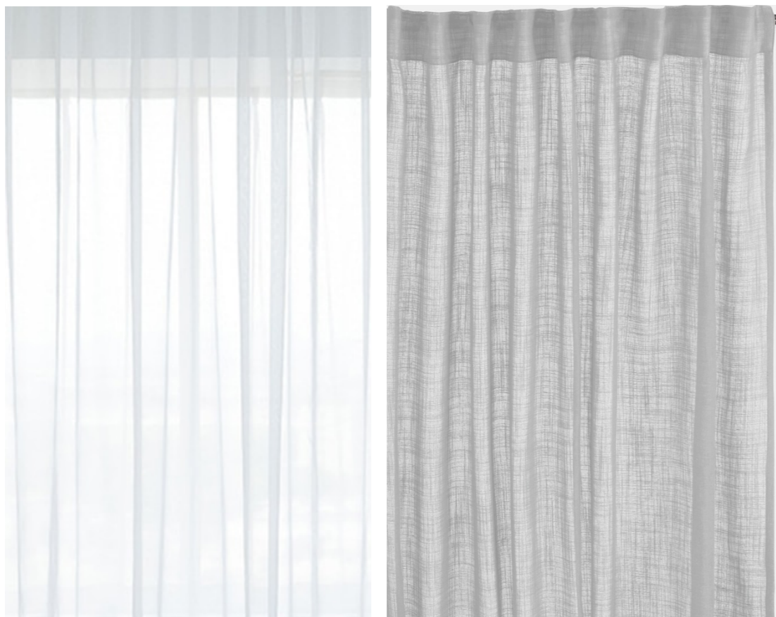
Záclona - bílá jemná struktura, bez vzoru Závěs světle šedý, bez vzoru např. styltex.cz