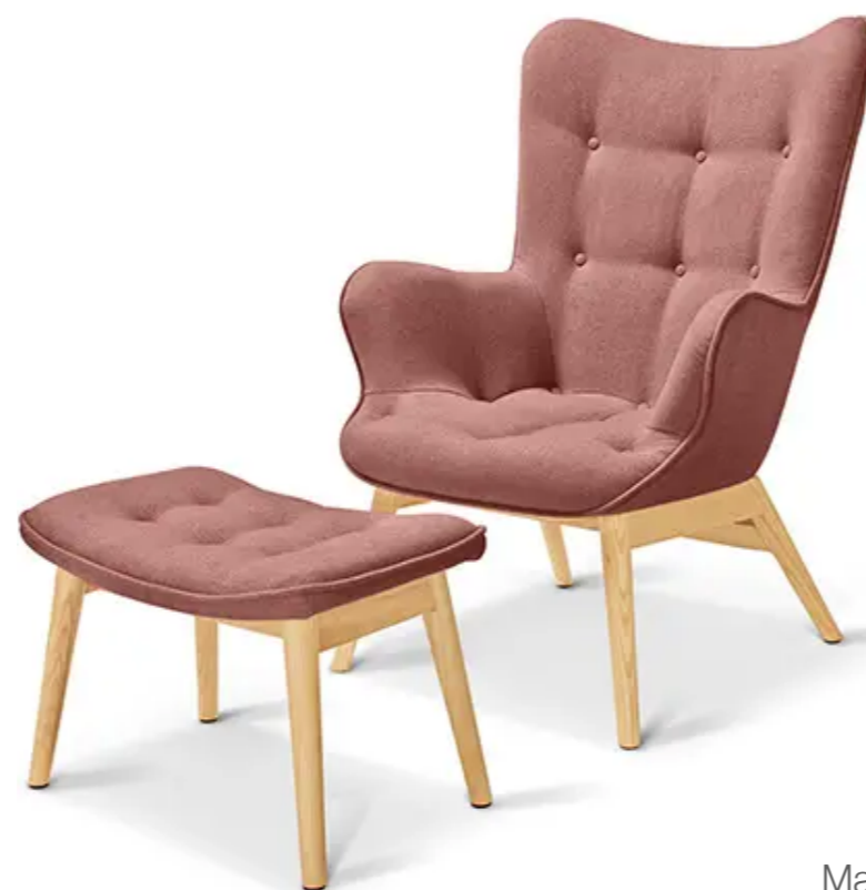
Křeslo s podnožkou