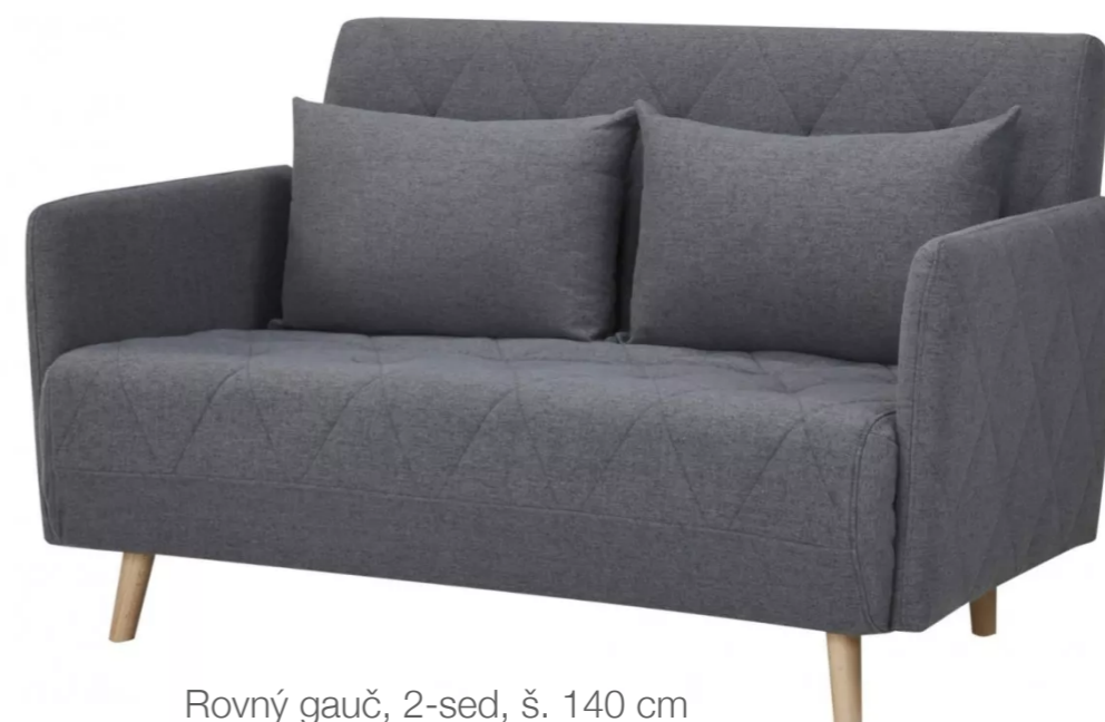
Rovný gauč, 2-sed, š. 140 cm