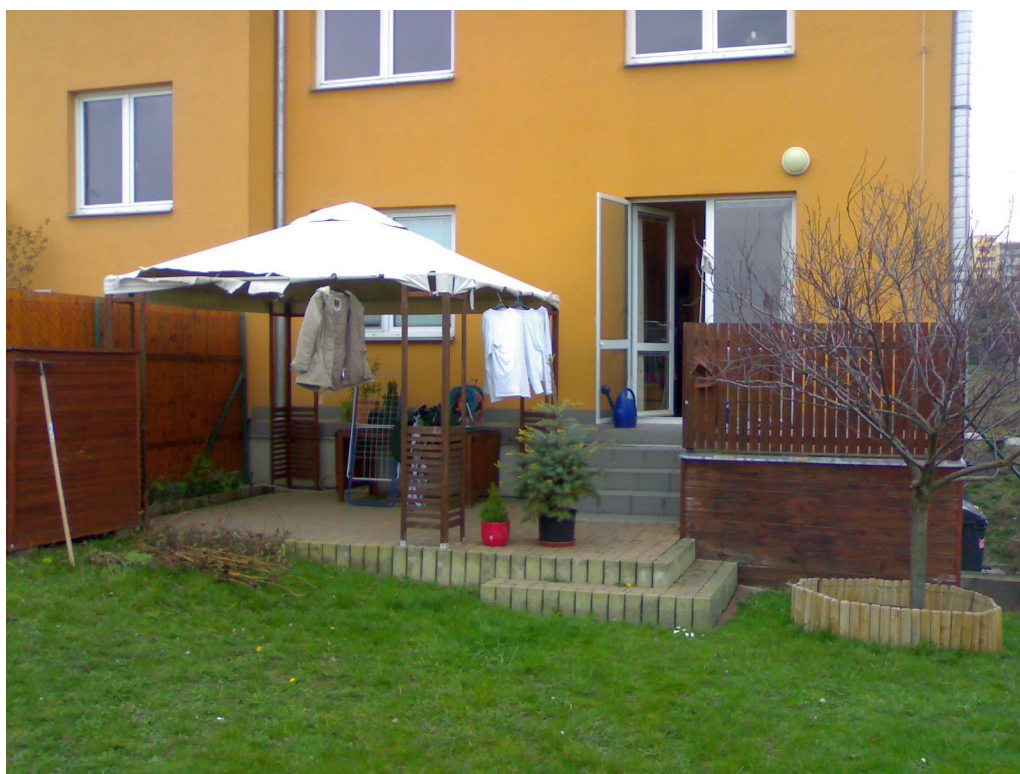
Ilustrace 5: Terasa - pohled z čela