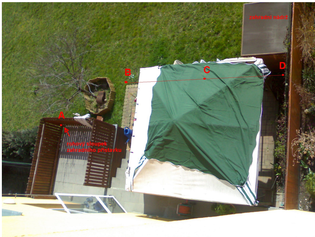
Ilustrace 3: Terasa - pohled shora