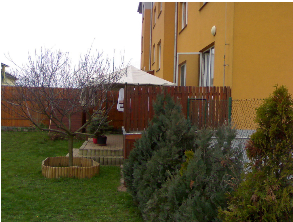
Ilustrace 4: Terasa - pohled z boku